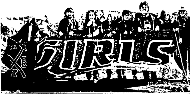
URB GIRLS SUL VESUVIO

ALLORA TANTO PER COMINCIARE POTREMMO DIRVI CHE ABBIAMO FOMINATE IL GRUPPO NEL 1983 QUANDO IL BOICOTTI ERA PER LA 4° VOLTA IN SERIE C (E GIÀ LA SCELTA DEL MOMENTO CALCISTICO HA DICE LUNGA);