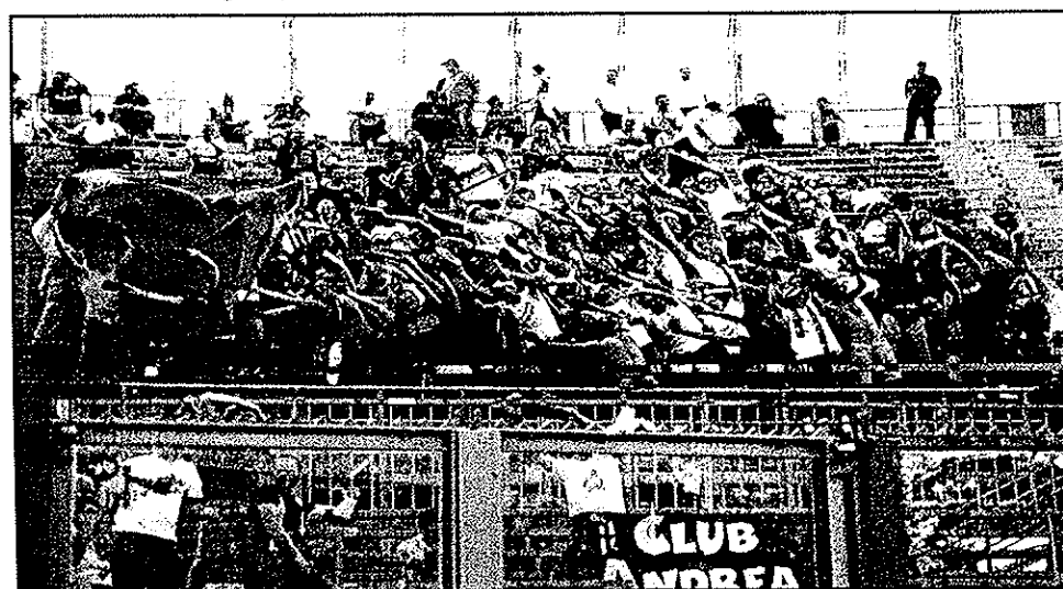
Albinoleffe-Bologna secondo tempo